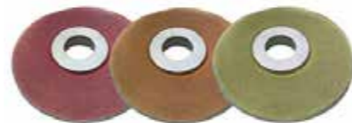
SHINEPRO SCREENS 220 / 400 / 600