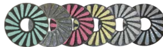
SHINEPRO PLUS PADS 50/120/220 / 400 / 800 / 1800 / 3500