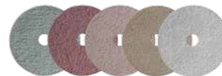
SHINEPRO PADS 220 / 400 / 800 / 1800 / BUFF